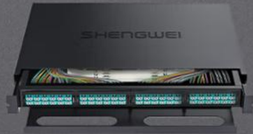
LC 多模96芯万兆 (MDF-201M-96L)