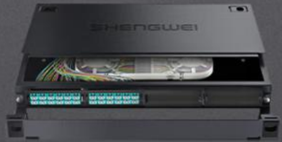
LC 多模48芯万兆 (MDF-101M-48L)