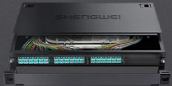
LC 多模72芯万兆 (MDF-101M-72L)