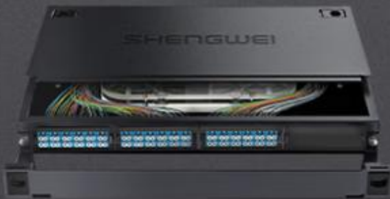
LC 单模72芯 (MDF-101S-72L)