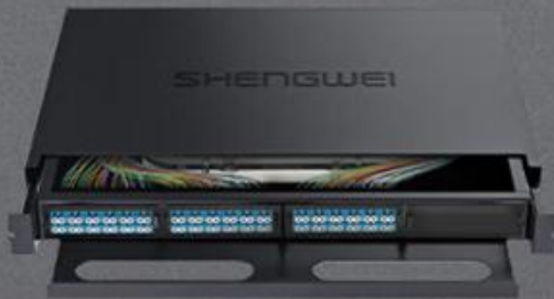
LC 单模72芯 (MDF-201S-72L)