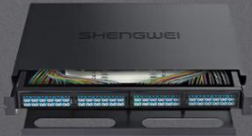
LC 单模96芯 (MDF-201S-96L)