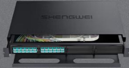
LC 多模48芯万兆 (MDF-201M-48L)