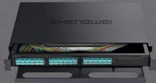
LC 多模72芯万兆 (MDF-201M-72L)