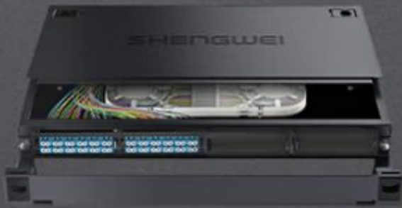
LC 单模48芯 (MDF-101S-48L)