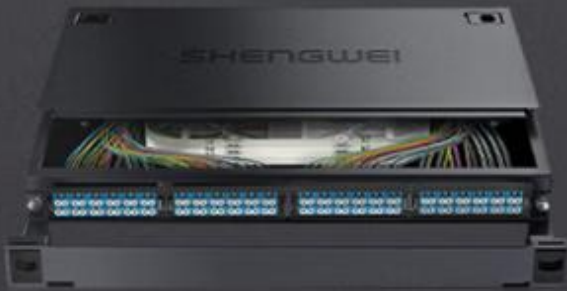
LC 单模96芯 (MDF-101S-96L)