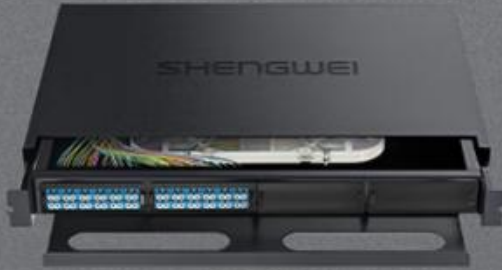
LC 单模48芯 (MDF-201S-48L)