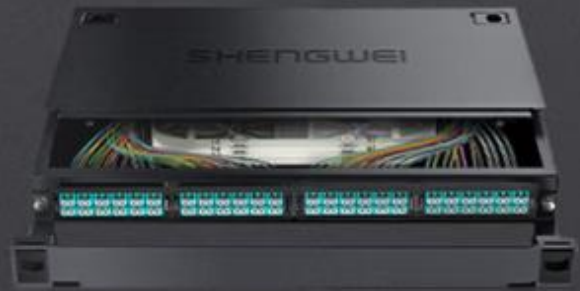
LC 多模96芯万兆 (MDF-101M-96L)